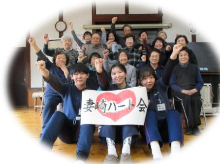
ご近所ふれあいサロンの様子