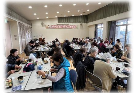
ふれあい昼食会の様子